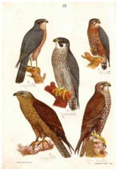
Nahoře zleva krahujec, sokol obecný, dřemlík, dole zleva včelojed, raroh velký