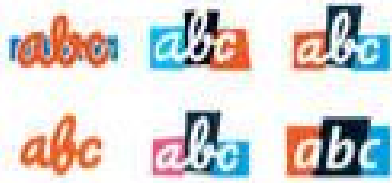
Logo časopisu ABC

Na obrázku vlevo jsou vidět všechny změny loga ABC až do roku 2003