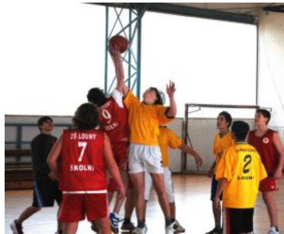
Jeden z našich borců při rozcvičování