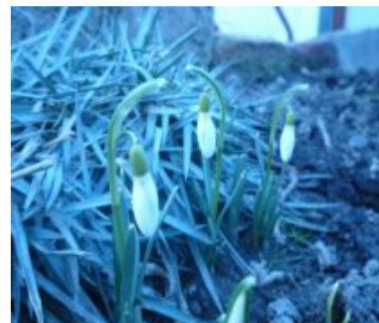
První letošní sněženky