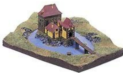
Vodní tvrz – jeden z modelů z časopisu ABC