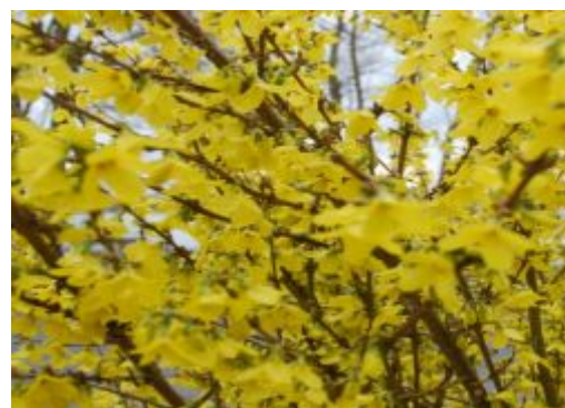
Zlatý děšť (zlatice) – jeden z poslů jara - obalený květy

Pozadu nezůstávají ani květiny, které už začaly pomalu rozkvétat. Teď, když je zima pryč, se všem zdá svět o hodně krásnější.