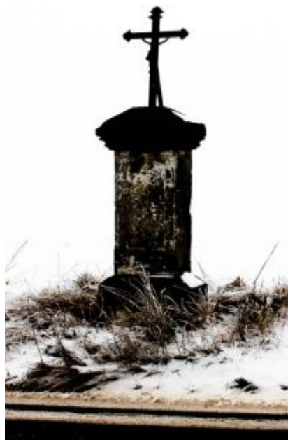
Křížek u Stradonic