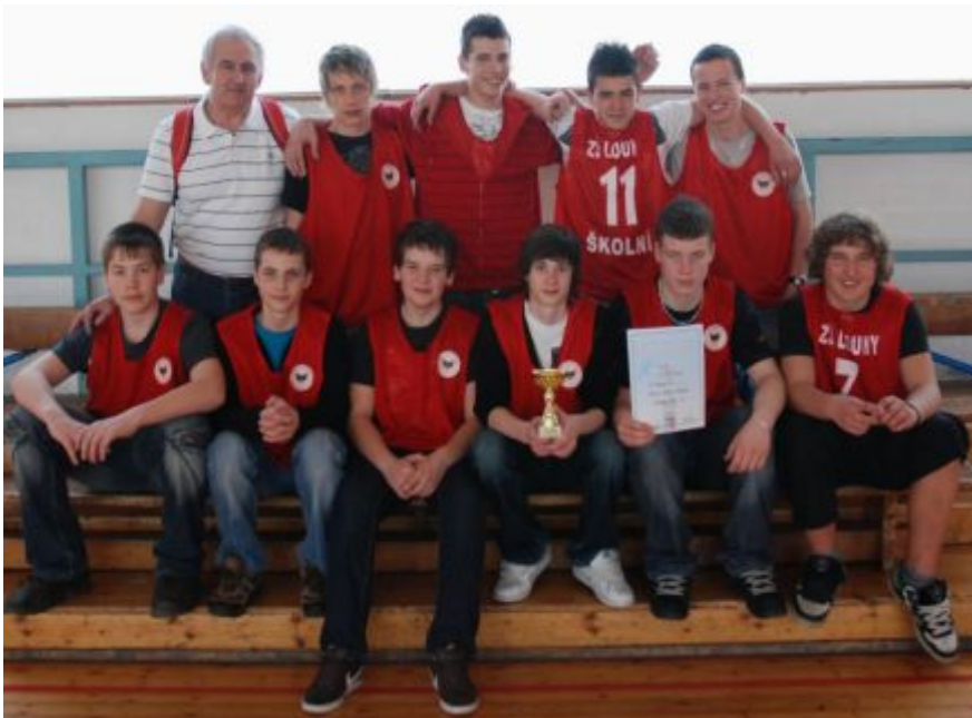
Reprezentanti školy po převzetí poháru a diplomu pro vítěze okresního přeboru

nevěděl, koho má mít. Začal druhý poločas a my se více soustředili na hru. Zpřesněly se přihrávky, střelba i obrana a technických chyb nebylo už tolik. Nakonec to náš tým dokázal a zvítězil. Byly to nervy! Poslední zápas - "lahůdka" proti domácímu týmu ZŠ Přemyslovců. Po tomto závěrečném vítězném zápase nás zaplavila ne malá vlna emocí a i na koučovi byla vidět radost. Vyhráli jsme všechna utkání a jsme znovu okresním přeborníkem! Po slavnostním vyhlášení jsme se nechali společně na památku vyfotit. Tento turnaj byl určitě přínosem pro všechny a sladká odměna od paní ředitelky nás neminula. A koučovi, tomu se splnilo jedno z přání, než odejde do důchodu.