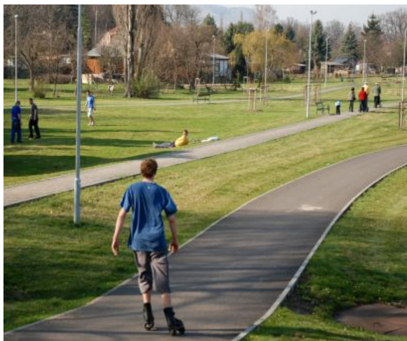
Odpočinek v nové části lounského parku, foto je

Pozadu nezůstávají ani květiny, které už začaly pomalu rozkvétat. Teď, když je zima pryč, se všem zdá svět o hodně krásnější.