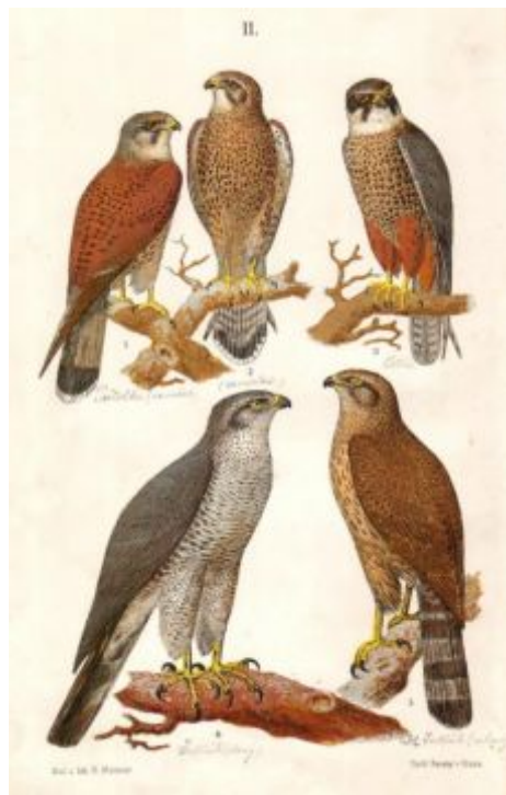
Nahoře zleva poštolka obecná-sameček, poštolka obecná-samička, ostříž, jestřáb – starý kus, jestřáb – mladý kus