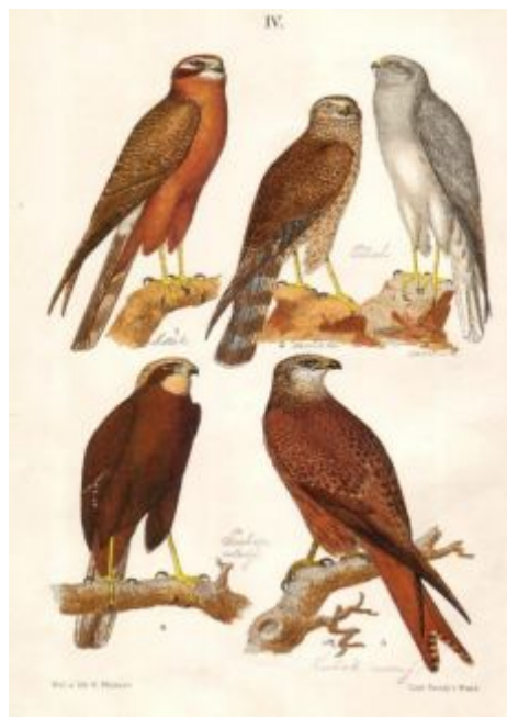
Nahoře zleva – moták, pilich-samička, pilich- sameček, dole zleva pochop-mladý kus, luňák červený