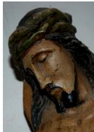
Detail Ježíše na kříži (barokní dřevořezba bohužel poničená vandaly)

(z Wi ki pedi e vybral a sestavi l Leoš Vostatek)