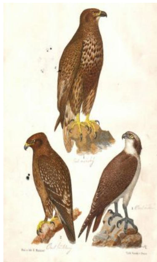
Nahoře orel mořský, dole zleva orel křiklavý, orel říční