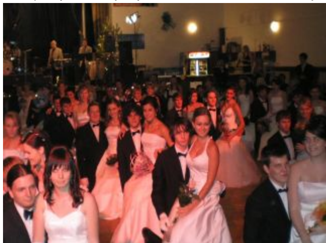
Lounské Taneční - lekce tance a společenského chování 2009 se již několik let bohužel odehrávají na sále v Dobroměřicích

V následující hodině jsme měli možnost číst z knihy od Ladislava Špačka (Slon v porcelánu), našeho uznávaného odborníka na etiketu. Z té jsme se poučili o správném chování v kině, divadle atd. Kniha je humorně zpracována, proto nás také tak bavila. Na závěr jsme celá třída vypracovali test, který nám po vyhodnocení ukázal, jak na tom jsme se znalostmi o správném chování.